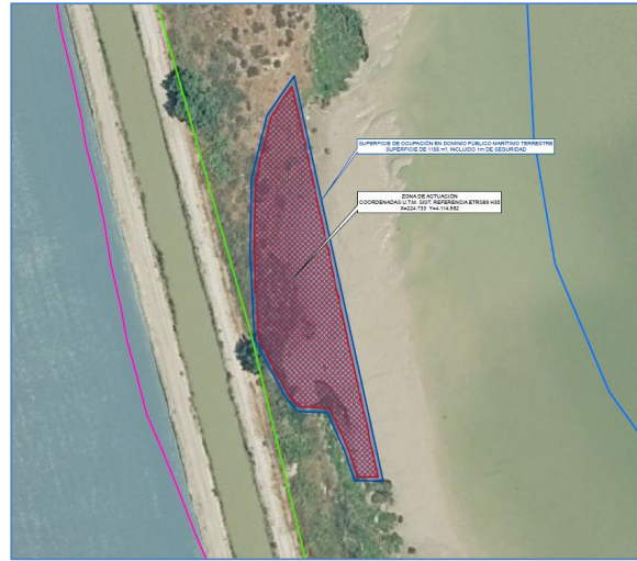
Figura 4. Vista en planta de la zona de actuación