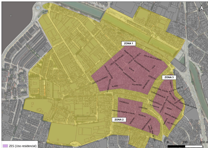
Figura 2. Delimitación de las zonas de especial sensibilidad de uso residencial.

La delimitación se establece conforme a lo representado en la figura 2.