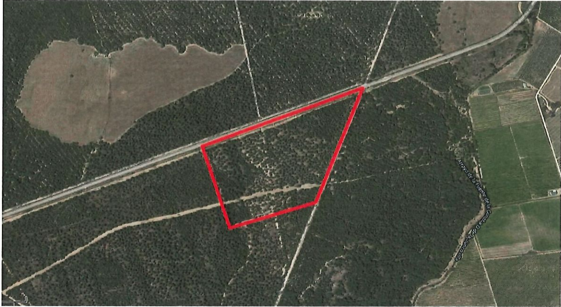
USOS DE LA FINCA ROMERÍA